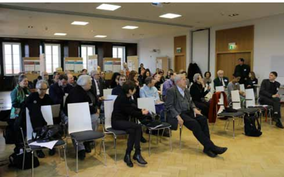
Conference participants during discussion / Konferenzteilnehmer bei der Diskussion.

Seit der Antike ist die Synagoge der Ort, an dem sich die jüdische Gemeinde regelmäßig zum Gebet aber auch zum sozialen Austausch versammelt. Ihre Lage, Architektur und Ausstattung sagt viel aus über