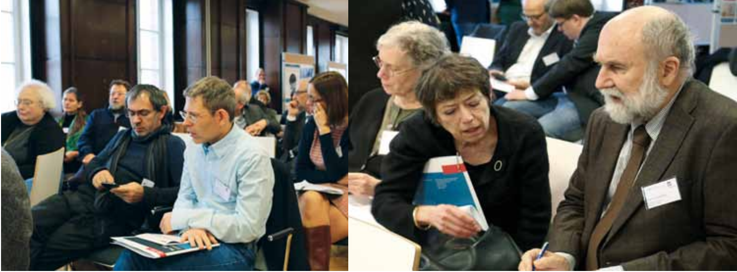
Conference participants during discussion / Konferenzteilnehmer bei der Diskussion.

die religiösen, sozialen, ökonomischen und künstlerischen Entwicklungen der jüdischen Kultur. Das wissenschaftliche Interesse an Synagogen und jüdischer materieller Kultur setzte bereits im 19. Jahrhundert ein und führte zur Etablierung der „Jüdischen Volkskunde“. Vor allem aber seit dem Holocaust kommt Synagogen auch eine bedeutende Rolle in der Gedenkkultur zu.