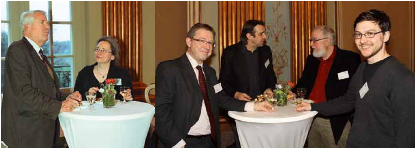
Braunschweig, reception at Richmond Palace.

Die Konferenz endete in der Villa Seligmann in Hannover, wo Gelegenheit zur Besichtigung des Gebäudes und der Bet Tfila-Ausstellung zu Reformsynagogen bestand, die hier noch bis zum 15. Juni 2014 zu sehen ist.